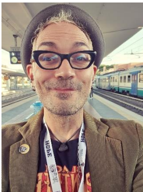
Davide Cali Liestal, Suiza, 1972

Está reconocido como uno de los autores para público infantil más innovadores y aclamados de Europa. Comenzó su carrera como escritor en 2004 y desde entonces ha publicado más de veinte títulos.