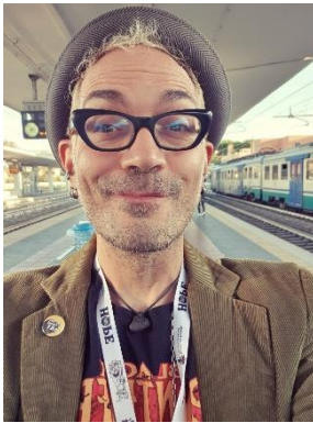
Davide Cali Liestal, Suiza, 1972

Está reconocido como uno de los autores para público infantil más innovadores y aclamados de Europa. Comenzó su carrera como escritor en 2004 y desde entonces ha publicado más de veinte títulos.